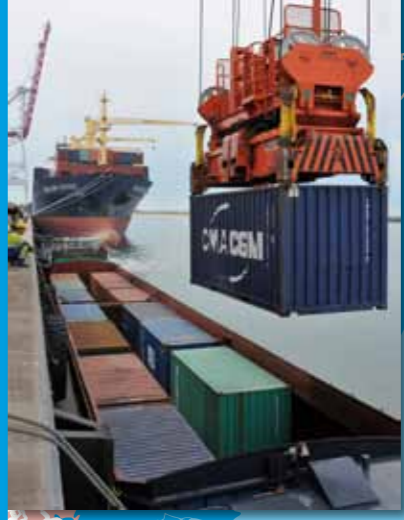
Chargement de conteneurs sur un automateur fluvial au terminal de Dunkerque - Port Ouest